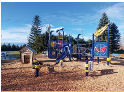
Les citoyens disposent de très nombreux parcs municipaux dotés d'installations de grande qualité.

Pour lui, les citoyens de Saint-Augustin-de-Desmaures sont choyés de pouvoir compter sur le dynamisme de femmes et d'hommes passionnés qui contribuent chaque jour à nourrir la population, à préserver le patrimoine et à faire rayonner le savoir-faire. Les membres du conseil municipal de Saint-Augustin-de-Desmaures entendent travailler au maintien et à l'amélioration de leur collaboration avec le secteur agricole afin qu'ensemble, ils continuent de faire de leur territoire un modèle de cohabitation équilibré entre les activités urbaines et rurales. Selon M. Juneau, tout le monde y gagne.