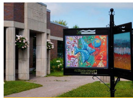
La culture est omniprésente à Saint-Augustin-de-Desmaures. Les tableaux de PrésentArt sont l'œuvre d'artistes locaux.